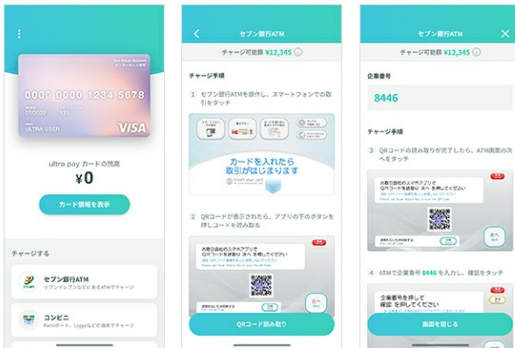
（図：セブン銀行ATMでのultra pay カード へのチャージ導線）

本提携によりultra pay カードのアカウントをお持ちのお客さまは、登録のスマートフォンから全国約25,000台以上のセブン銀行ATMで、原則24時間365日、ultra pay カードへのチャージが可能になります。